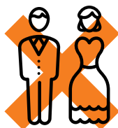
Uit elkaar gaan

Kijk dan op de SPF-website onder ' Mijn SPF Pensioen ' of op mijnpensioenoverzicht.nl . Op deze plekken kun je straks ook je nieuwe pensioen inzien. Laat je helpen als je er zelf niet uitkomt.